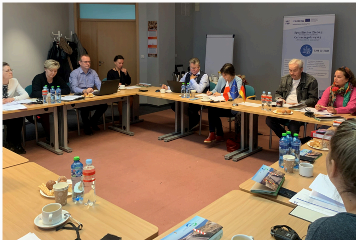
Posiedzenie Euroregionalnego Komitetu Sterującego Interreg VIA, Szczecin 2023

Trzydniowa wizyta studyjna burmistrzów i urzędników z Łotwy w Szczecinie i w Gryfinie. Tematem wizyty było bezpieczeństwo.