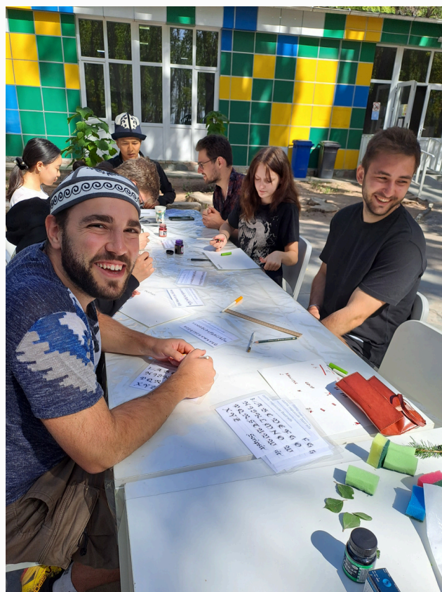
Zajęcia z kaligrafii, Jetigen 2023 r.

„Bałem się, że ludzie będą bardzo zamknięci”