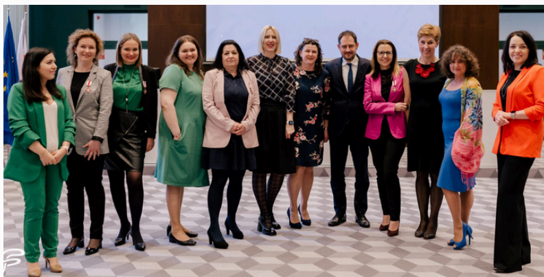
Jubileusz 30-lecia SGPEP, Szczecin 21 kwietnia 2023 r.

Uczestnictwo w polsko-niemieckiej konferencji dla wnioskodawców PNWM w Lublinie zorganizowanej przez Biuro PNWM.