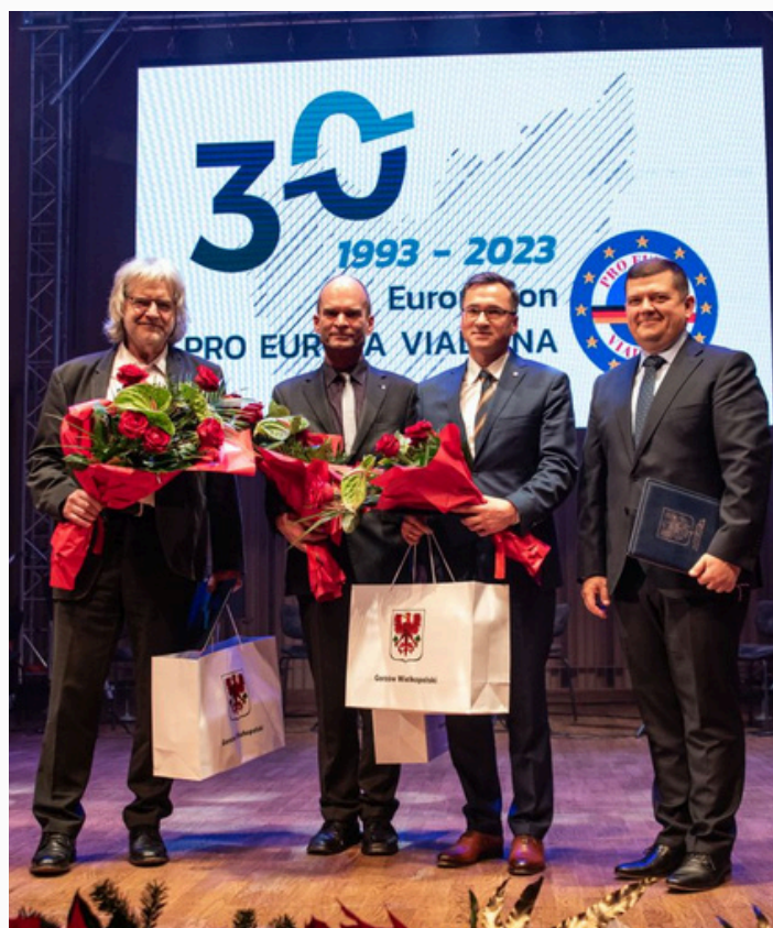
30-lecie Euroregionu Pro Europa Viadrina, Gorzów 12 grudnia 2023 r.

Polsko-niemiecka Wigilia w Szczecinie z udziałem pracowników obu biur.