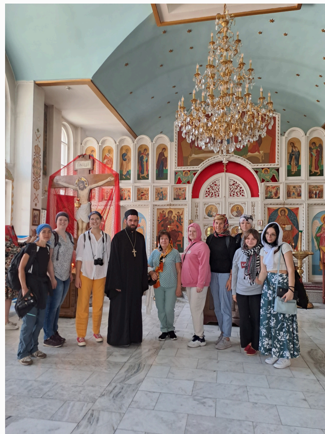
Wizyta w prawosławnej cerkwi, Biszkek 2023 r., fot. SGPEP

Dyskusja z przedstawicielką organizacji feministycznej z Kirgistanu z kolei pozwoliła poznać problemy młodych kobiet, podporządkowanych najpierw ojcom, a później mężom, problemy z przemocą domową czy ubóstwem. Silne emocje młodych ludzi wzbudziła także wizyta w Jetigen opozycjonisty politycznego. Prześladowania przeciwników politycznych, rewolucje po wystąpieniu ze Związku Radzieckiego i brak nadziei na zmianę - przygnębiały. Tym bardziej, że młodzi Kirgizi okazali się otwartymi na naszą kulturę, ciekawymi świata ludźmi. Niezapomnianym punktem projektu był kilkudniowy pobyt wśród tubylców i wspólne mieszkanie w górach w jurtach.