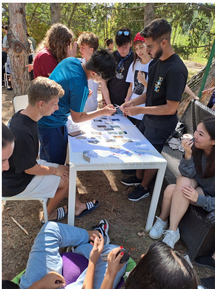
Warsztaty ekologiczne w ramach Clima Camp, Jetigen 2023 r.

Mieliśmy przekonanie, że uczestniczymy w ważnym wydarzeniu, że możemy wpłynąć na życie wielu młodych ludzi, także tych w oddalonym o 6 tysięcy kilometrów Kirgistanie.