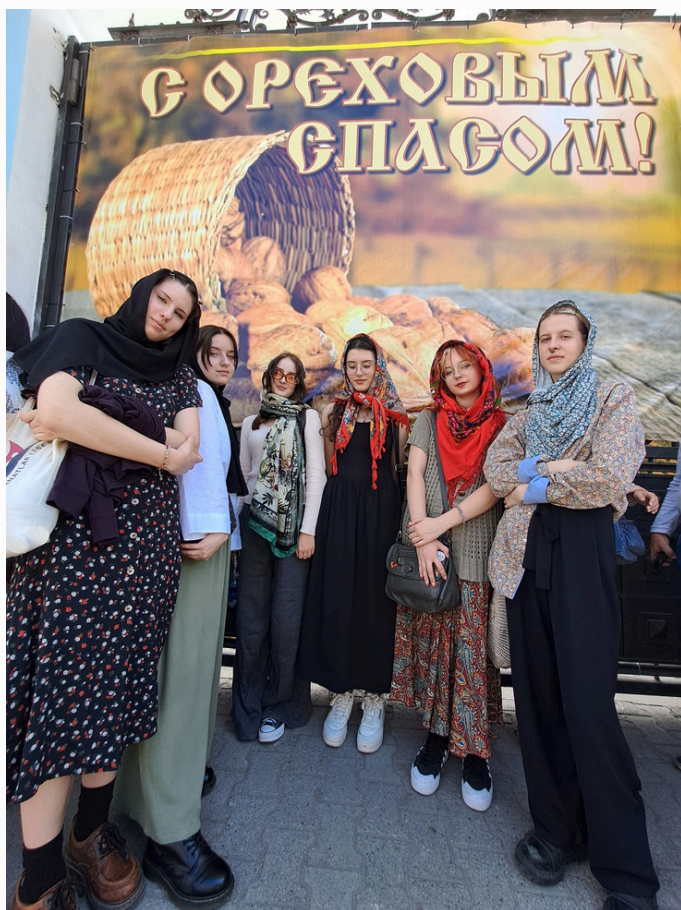
Wizyta w prawosławnej cerkwi, Biszkek 2023 r.

W Kirgistanie żyją dzisiaj 82 narodowości. Jest to kraj postsowiecki, który wciąż szuka swojej tożsamości. Próbą zrozumienia tej skomplikowanej sytuacji były wspólne warsztaty w Muzeum Historycznym w centrum Biszkeku. Zbiory muzeum nie są zbyt bogate, ale sposób w jaki Kirgizi eksponują swoją kulturę: jurty, stroje Nomadów, broń, biżuterię, historię jedwabnego szlaku i miłość do koni – wzbudziły nasz szacunek.