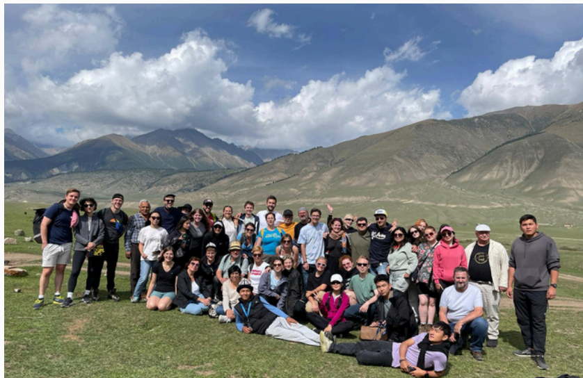
Polsko-niemiecko-kirgiski projekt młodzieżowy, Kirgistan 2023 r., fot. SGPEP

Pierwszy projekt poświęcony był ochronie klimatu (z polskiej strony uczestniczyła młodzież z Łobeskiego Domu Kultury), drugi sztuce (uczniowie Liceum Plastycznego w Szczecinie), a trzeci dokształcaniu pedagogów w dziedzinie interkulturowości. W delegacji specjalistów znaleźli się przedstawiciele Uniwersytetu Szczecińskiego, Pałacu Młodzieży, Fundacji Juchowo, Łobeskiego Domu Kultury, Szkoły Podstawowej Nr 1 w Barlinku i SGPEP.