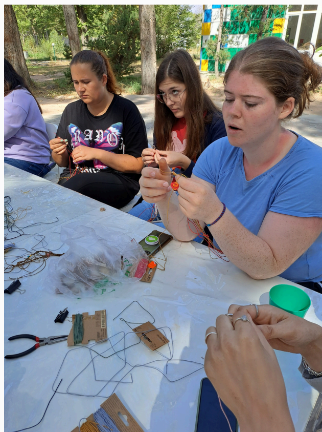
Warsztaty z tworzenia biżuterii, Jetigen 2023 r., fot. SGPEP

„Byłem sceptyczny co do kultury i zwyczajów innych uczestników. Miałem złe przeczucia co do mieszkania razem z przypadkowymi ludźmi, których nie znam”