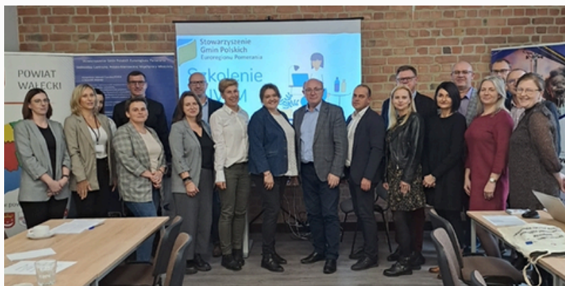
Szkolenie PNWM dla nauczycieli z powiatu Wałeckiego, Wałcz 16 listopada 2023 r.

Uczestniczyli w nich przedstawiciele szkół średnich, realizujący już projekty międzynarodowe, jak i zainteresowani nawiązaniem współpracy polsko-niemieckiej.