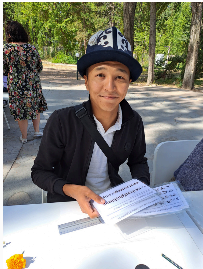
Zajęcia z kaligrafii podczas warsztatów artystycznych, Jetigen 2023 r.

Pierwsza trójnarodowa grupa zajmowała się problemami współczesnego klimatu, ochrony środowiska, przetwarzania wtórnego odpadów, problemem braku wody pitnej w Kirgistanie i sąsiadujących krajach. Młodzież swój program rozpoczęła warsztatami w Jetigen nad jeziorem Issyk-kul. Był to czas integracji, przełamywania własnych barier (językowych, kulturowych), definiowania oczekiwań i pierwszych warsztatów na terenie otwartego Muzeum Petroglifów (najstarsze wykopaliska z rysunkami na kamieniach, które zostały zebrane z okolicy miasta Houpa-Opa). Podczas pobytu w Kirgistanie był czas na zwiedzenie Biszkeku, wycieczkę w wysokie góry, zwiedzanie XI-wiecznej Wieży w Buranie czy pobyt w oddalonym o 150 km od granicy z Chinami – Karakolu.