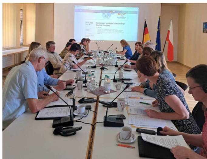
Posiedzenie Euroregionalnego Komitetu Sterującego Interreg VIA, Löcknitz 2023

W lipcu 2023 roku w procedurze obiegowej Komitet Monitorujący Programu Interreg VIA zatwierdził złożony przez Stowarzyszenie Gmin Polskich Euroregionu Pomerania, Fundusz Małych Projektów w Celu Szczegółowym 4.6 „Wzmacnianie roli kultury i zrównoważonej turystyki w rozwoju gospodarczym, włączeniu społecznym i innowacjach społecznych”.