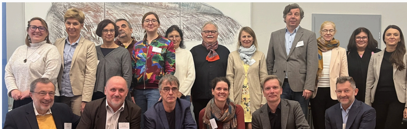
Posiedzenie Polsko-Niemieckiej Grupy Roboczej ds. Wytycznych PNWM, Berlin 20 listopada 2023 r.

Spotkanie z dyrekcją Teatru Współczesnego w Szczecinie w sprawie projektu składanego do FMP na realizację Festiwalu Kontrapunkt.