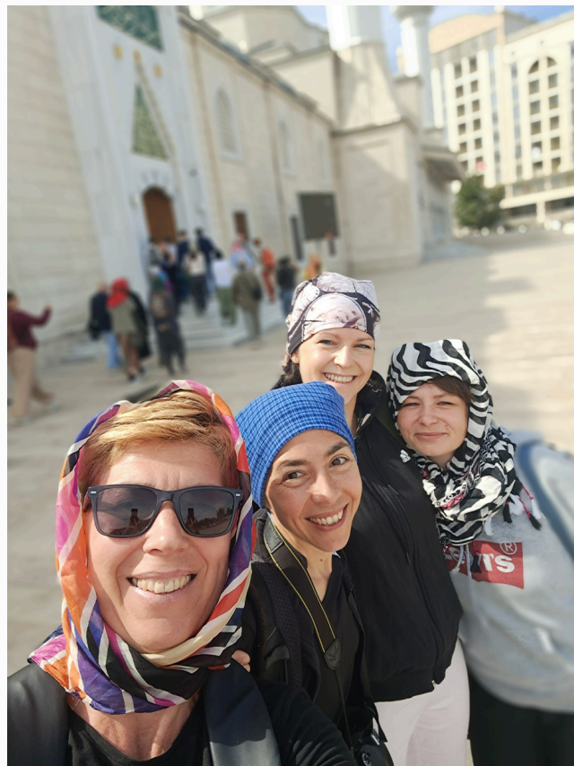
Wizyta w meczecie, Biszkek 2023 r., fot. SGPEP

Istotną częścią projektu była burza mózgów dotycząca przyszłych partnerstw. Rozmowy były bardzo otwarte, a plany krystalizowały się z każdym dniem. W grudniu 2023 r. partnerzy spotkali się na podsumowaniu współpracy w placówce bawarskiej, a w maju 2024 r. młodzi Bawarczycy i Kirgizi odwiedzili Szczecin. Animatorzy kreowali również własne warsztaty dla młodzieży, ale też uczestniczyli jako obserwatorzy w programach grup młodzieżowych. Interującym przeżyciem był udział w warsztatach na temat podejmowanego przez