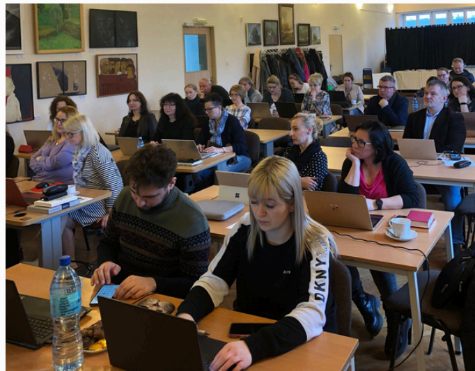
Warsztaty PNWM - wnioskowanie online, Szczecin 24 marca 2023 r.

Spotkanie robocze w Löcknitz w sprawie złożenia projektu dotyczącego przyszłego Europejskiego Ugrupowania Współpracy Terytorialnej.