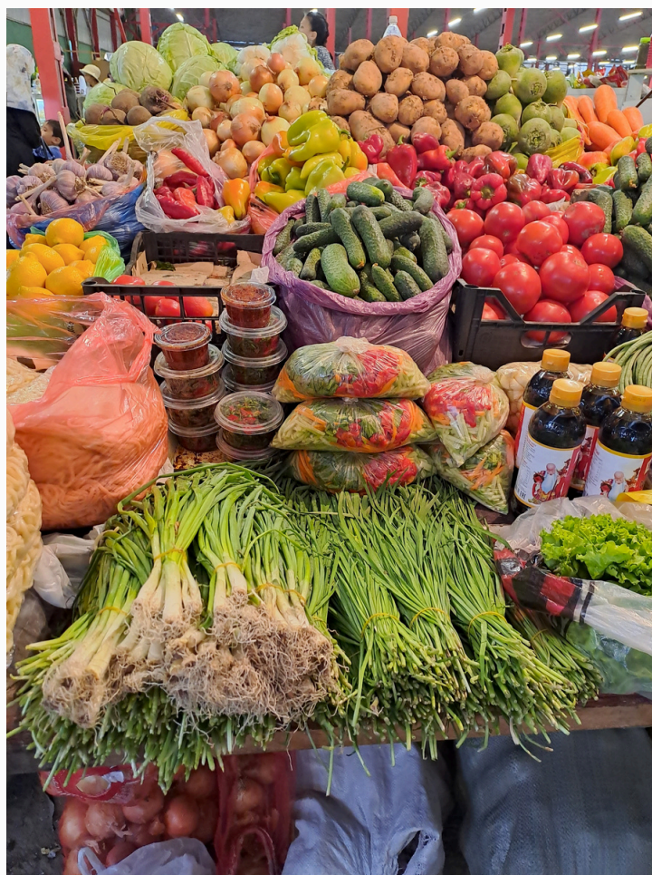
OSH Bazar, Biszkek 2023 r.

„Rzeczywiste przeszkody i problemy były zupełnie inne od tych, o których myśleliśmy, że mogą się pojawić, ale tak egzotyczny projekt jest możliwy do zrealizowania”