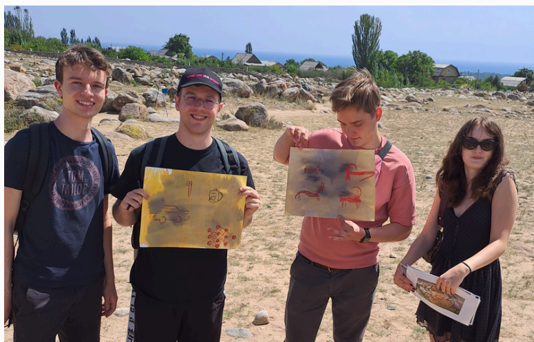
Rysunki powstałe podczas zajęć w Muzeum Petroglifów, 2023 r., fot. SGPEP

„Na początku obawiałem się, że spotkanie się z ludźmi z różnych krajów/kultur musi być trudne”