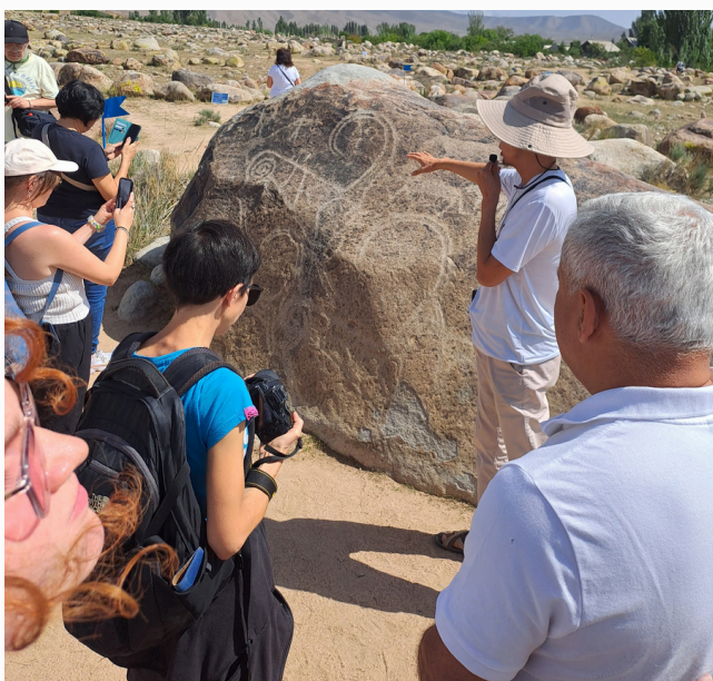
Muzeum Petroglifów, 2023 r.

„Kirgistan to kraj o skomplikowanym krajobrazie politycznym, wielu problemach i zaangażowanych w nie podmiotach. Kraj jest niesamowicie piękny, a jedzenie różnorodne i smaczne”