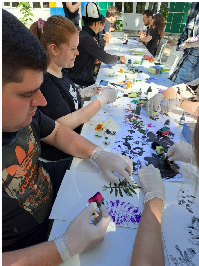
Warsztaty artystyczne, Jetigen 2023 r., fot. SGPEP

Druga polsko-niemiecko-kirgiska grupa młodych uczestniczyła w warsztatach artystycznych. Wspólne malowanie, tworzenie komiksów, wykonywanie biżuterii przełamało lody już na początku spotkania. Tu potwierdziła się stara prawda, że pasja łączy i tworzy wspólny język. Młodzież wzrastała jako grupa. Uczestniczyła z dużym zaangażowaniem w warsztatach na temat kolonializmu, europejskiego punktu widzenia świata i wpływu zachodu na kraje azjatyckie. Komunikowała się po angielsku i była aktywna podczas prowadzonych dyskusji. Nie dziwi więc, że kolejne polsko - niemiecko - kirgiskie spotkanie młodzi mają już za sobą. W połowie maja 2024 r. do Szczecina na zaproszenie Liceum Plastycznego przyjechali młodzi Bawarczy i Kirgizi. Było ich widać w całym mieście, promieniowali podczas wspólnych warsztatów i wycieczek. Kolejne spotkanie młodzi planują w przyszłym roku w Bawarii.