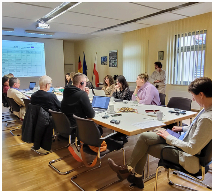
Posiedzenie Euroregionalnego Komitetu Sterującego, Löcknitz 2023, fot. SGPEP

Organizacja szkolenia online z dotacji PNWM.