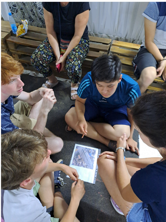
Dyskusja o ponoszonym ryzyku w życiu młodych ludzi, Jetigen 2023 r.