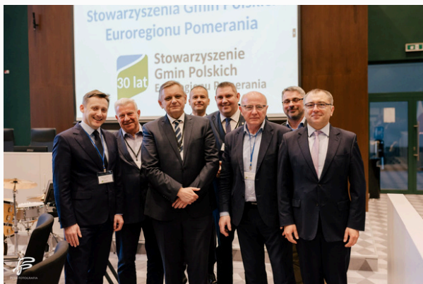
XXVII WZD SGPEP, Szczecin 21 kwietnia 2023 r.

21.04.2023 Jubileusz 30-lecia SGPEP oraz XXVII Walne Zebranie Delegatów.